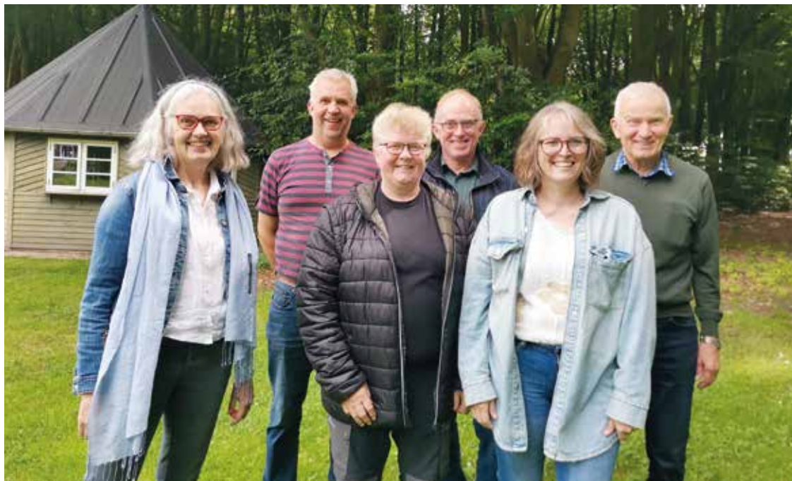
Det siddende menighedsråd ved Væggerskilde kirke.

end mig, der har ledelses-erfaring eller kendskab til fagforening og overenskomster. Og dem kan jeg spørge om råd i konkrete situationer”.